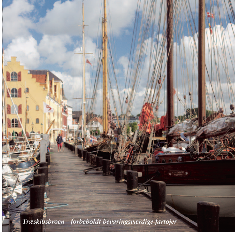
Træskibsbroen - forbeholdt bevaringsværdige fartøjer

Herfra arrangeres ture med de træskibe som hører under Centeret, og med jævne mellemrum er der musik og markeder med fokus på det gode liv i en Cittaslow by.